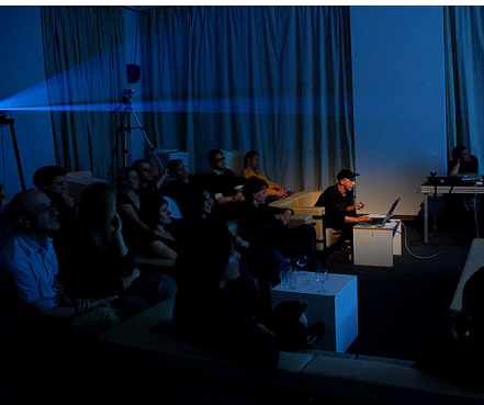
Lecture @ Medienkunsthaus Tesla 2007