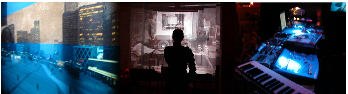
triPhaze/ privatelektro visuals and live setup

2 channels sound system with sub-low 4 Loudspeakers 1 crossover for sub low 1 table or Work surface for instrument Set (at least 70cm. X 90cm.) Cables and connectors for all system Plugs, DI Box 1 DvD Player with Cables and Connections to a Videoprojector