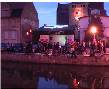
triPhaze: Musik für Fische, Garage Festival 2004

Nachtmusik für Fische – Garage zeigte Weltpremiere